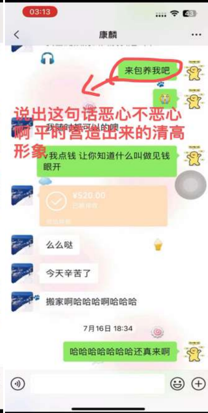
和闺蜜探讨骗钱实锤