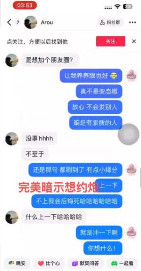
约炮次数与日期与记录完全吻合